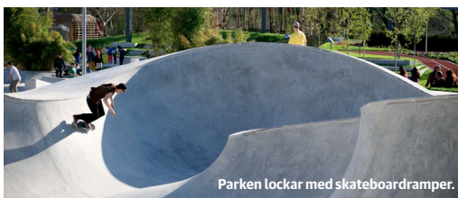
Parken lockar med skateboardramper.