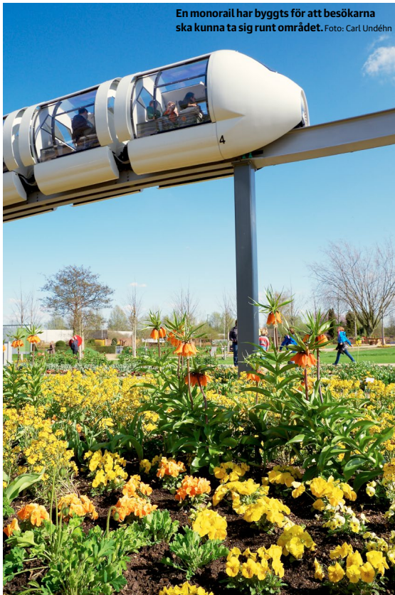
En monorail har byggts för att besökarna ska kunna ta sig runt området.