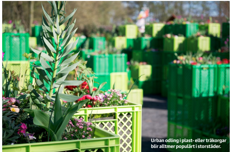
Urban odling i plast- eller träkorgar blir alltmer populärt i storstäder.